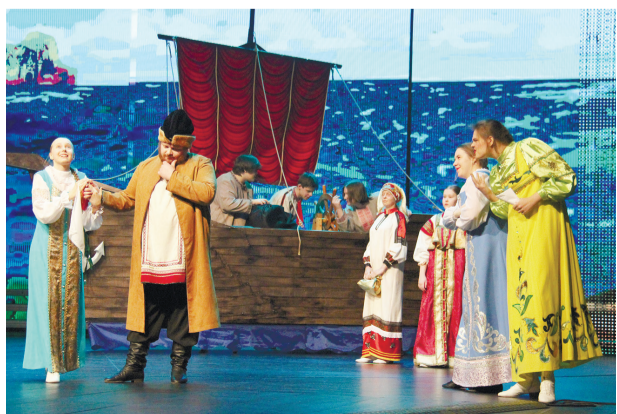
Отрывок из спектакля «Аленький цветочек». Театр «Ритм».