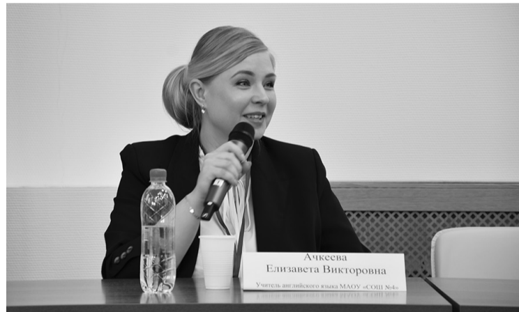
На пресс-конференции «Вопрос учителю года» финалисты конкурса отвечали на актуальные вопросы по воспитанию, развитию и обучению детей школьного возраста. | Фото: Валерия Козлова, «Губкинская неделя».

В детском саду «Непоседы» проходило конкурсное испытание «Педагогическое мероприятие с детьми». | Фото: Валерия Козлова, «Губкинская неделя».