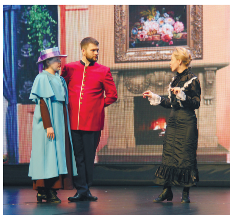
Отрывок из спектакля «История Сары Кру». Театр «Ритм».