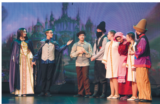
Отрывок из спектакля «Звёздный мальчик». Театральный коллектив «Праздник».