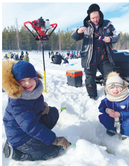
Маленькие помощники настоящих рыбаков.