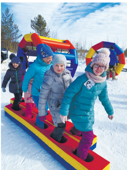
Пока взрослые рыбачат, дети развлекаются.