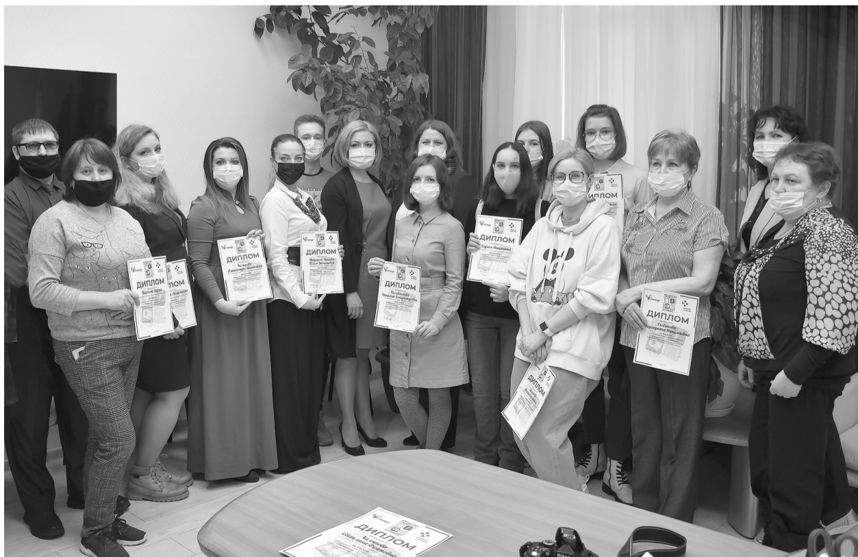
Победители и призёры конкурса «Профессия – журналист – 2021».

Согласно положению о конкурсе, творческие работы победителей в течение года будут опубликованы в газете «Губкинская неделя». А лучшие фотоработы представят на выставке «Полёт творческой профессии» в центре занятости населения города.